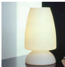
■ Lampe de chevet blindée

Les lampes de table à abat-jour blindés sont destinées à