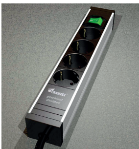
■ Multiprise blindée

Cette multiprise blindée élimine l'électromog ou pollution électrique de basse fréquence.