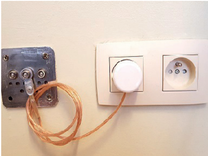
■ Kit de raccordement à la terre