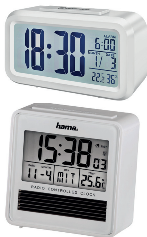
■ Radios Réveil solaire ou à piles